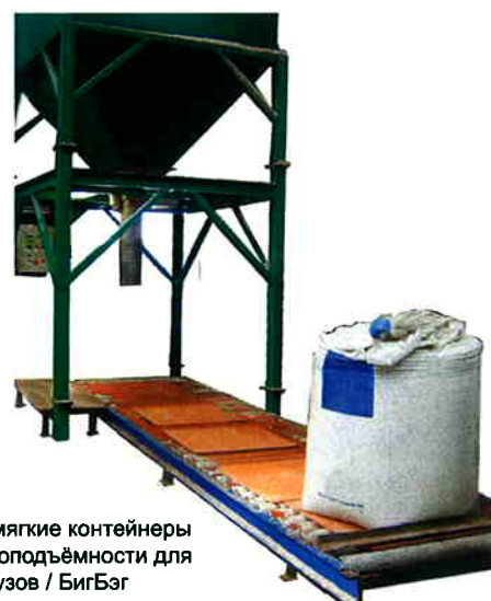
Экономик - мягкие контейнеры средней грузоподъемности для насыпных грузов / БигБэг

Машину можно заказать в нескольких конфигурациях. Аппарат Биг Бэг экономик - стационарная машина с зафиксированным бункером для хранения над ней. Второй вариант - это Биг Бэг Лоу Профайл - передвижная установка. Не составит труда переместить ее на новое место при помощи вилочного погрузчика, продукты так же с легкостью загружаются непосредственно в бункер, минуя стадию хранения, как в вышеуказанном варианте. Производственные мощности обеих систем - 30 тонн в час с мешками в 1000 кг и приблизительно 50 мешков объемом в 500 кг. По желанию заказчика мы можем внести изменения в конфигурацию машины.