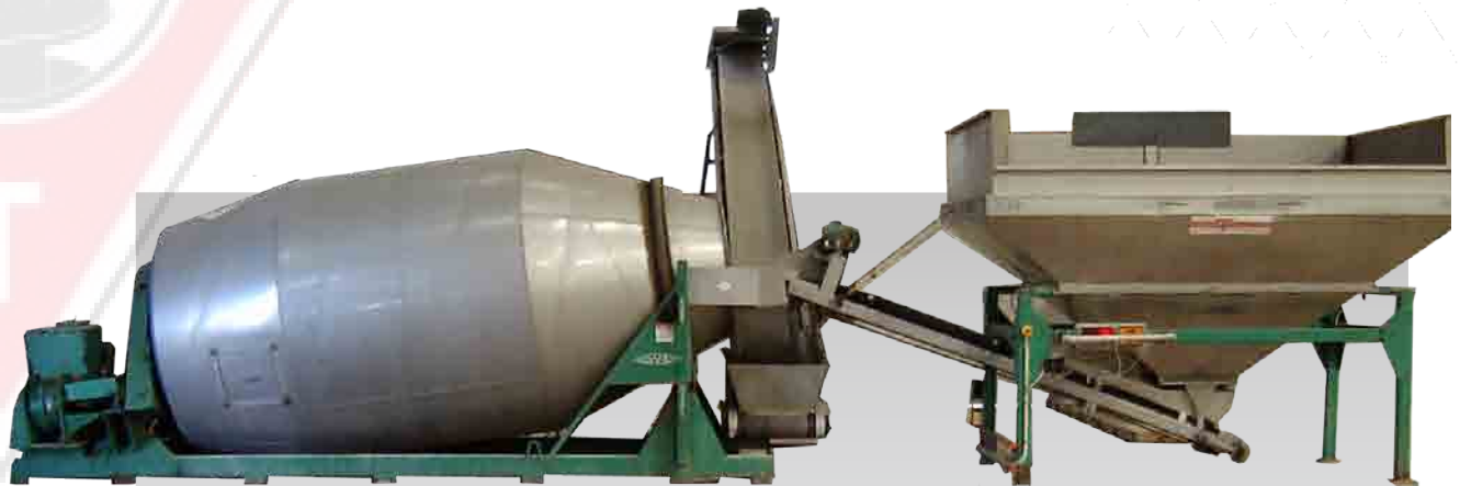
9 тонный смеситель Шамрок

Производительность От 20 до 60 тонн/м3 в час Размер 4,5 - 7 - 9 тонн за партию