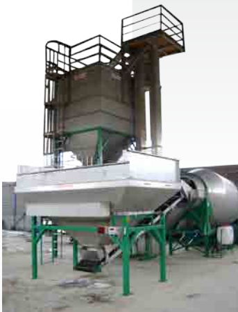
7 тонный смеситель

Удобрения поступают в барабан смесителя из заполненного бункера через передаточный транспортер. Дальше идет процесс приготовления смеси. Барабан заполняется с фронтальной стороны, после чего начинает крутиться по часовой стрелке. Процесс приготовления смеси максимально прост: витки внутри барабана заставляют ингредиенты двигаться волнообразно при движении самого барабана. Как только смесь готова, машина останавливается и поворачивается в обратном направлении.