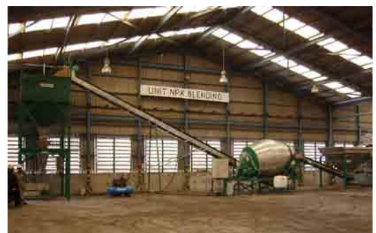
4,5 тонный смеситель Шамрок