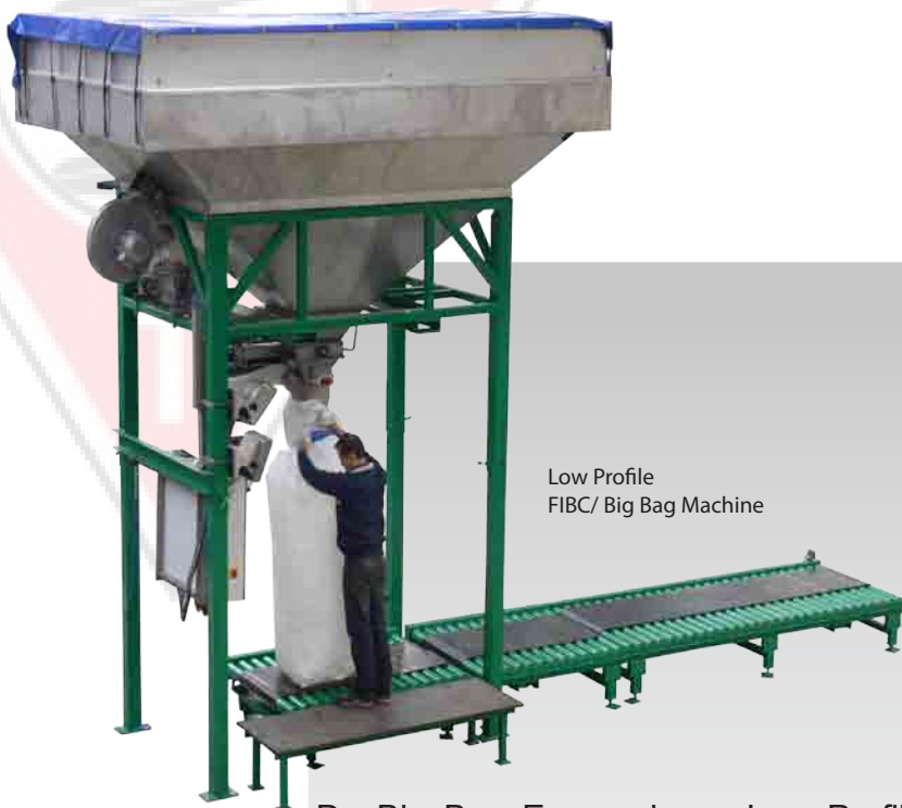
Low Profile FIBC/ Big Bag Machine

De Big Bag Economic en Low Profile Unit zijn gemaakt om FIBC (Flexible, Intermediary, Bulk, Containers) zakken te vullen. De machine weegt en vult automatisch en kan 100 tot 1.250 kg zakken vullen. Deze machine is geschikt voor poeder en gegraneerd materiaal. De voorraadbunker staat op 4 H-profiel poten en is voorzien van een pneumatische schuif met grote en kleine openingen. De voorraadbunker lost in de roestvast stalen pijp die in de Big Bag past. De Big Bag staat op een platform weegschaal op de vloer. De Big Bag dient met de hand om de vulpijp vastgehouden worden, zodat er tijdens het vulproces geen stof vrijkomt. De hoogte van de vulpijp is verstelbaar over een lengte van 400 mm. Voor het vullen begint, blaast een blower lucht in de zak totdat de zak goed open geblazen is. Vervolgens valt het product in de zak. De load cell weegschaal op het platform bepaalt het gewicht van het product.