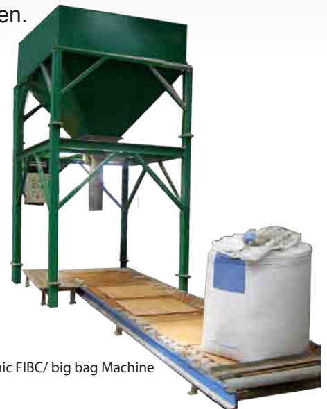
Economic FIBC/ big bag Machine

Als de zak vol is wordt deze door middel van een roltransportband weggevoerd. Het weegsysteem werkt met een weegindicator van Avery Salter Weightronix. De hele machine kan automatisch en handmatig worden bediend. De machine is uitgevoerd met pneumatisch roestvast stalen en Fiberglas cilinders. De Big Bag Economic is een vaste machine met een voorraadbunker bovenop. De Big Bag Low Profile is een machine die d.m.v. een heftruck verplaatst kan worden. De machines kunnen met een heftruck schepbak direct in de weegbunker worden gevuld. De capaciteit van beide systemen zijn 30 ton per uur met zakken van 1.000 kg en ongeveer 50 zakken van 500 kg per uur. Deze machines zijn verkrijgbaar in verschillende opstellingen en kunnen aan de wensen van de klant aangepast worden.