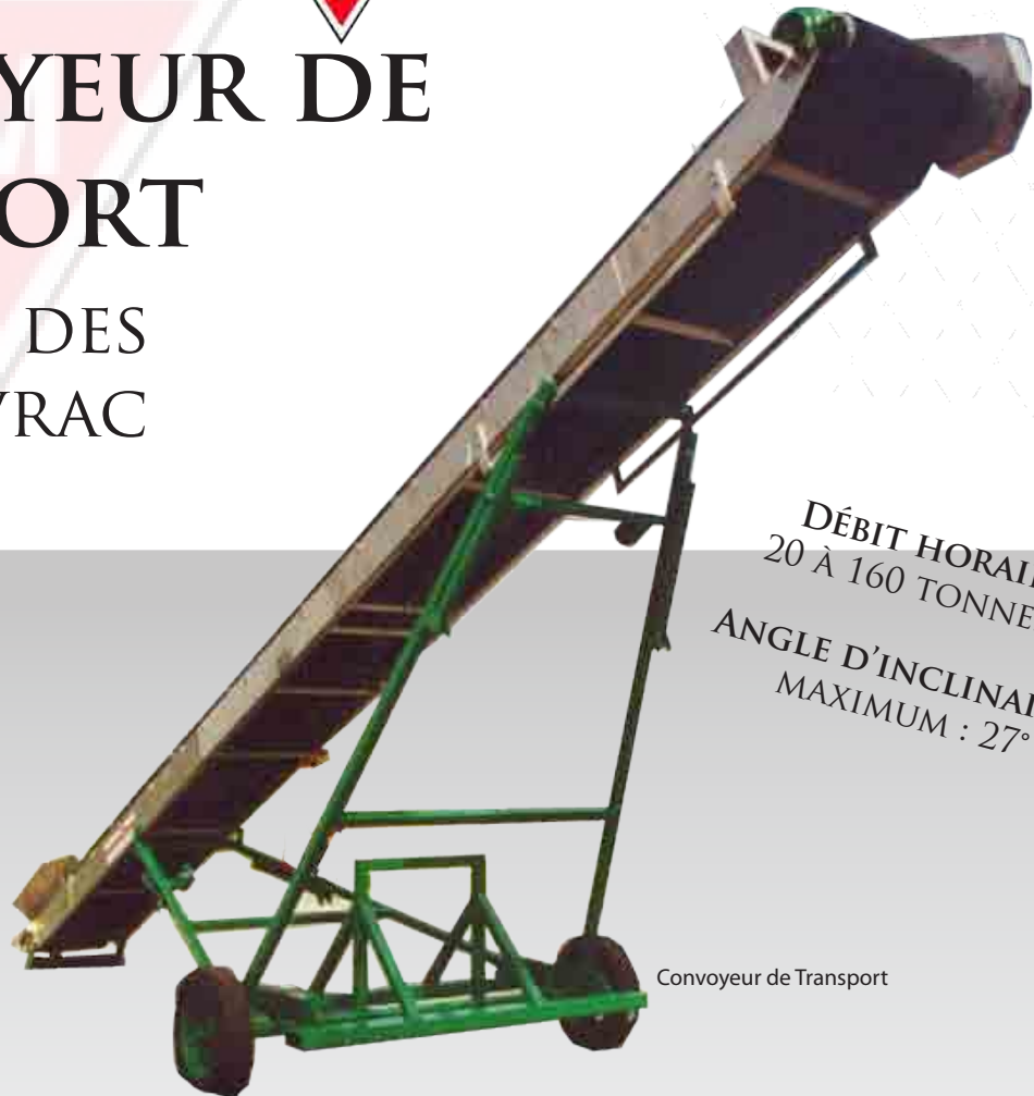
Convoyeur de Transport

DÉBIT HORAIRE : 20 À 160 TONNES/M 3 ANGLE D'INCLINAISON MAXIMUM : 27°