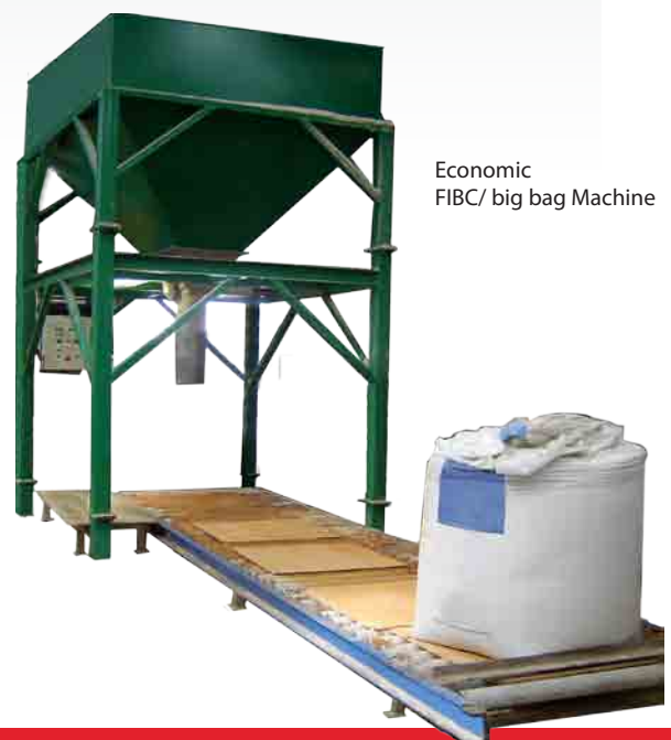
Economic FIBC/ big bag Machine

L'appareil peut opérer automatiquement ou manuellement. Les vannes et vérins pneumatiques sont en inox et fibres de verre. La machine peut être fabriquée en différentes variations : Le Big bag Economic est une machine fixe avec une trémie tampon en tête et le Big bag Low Profile est une machine mobile qui peut être déplacée à l'aide d'un chariot élévateur. Les 2 systèmes sont d'un débit horaire de 30 tonnes (sacs d'une tonne) ou 40 à 50 sacs de 500 kilos. Ils peuvent être adaptés aux besoins spécifiques du client.