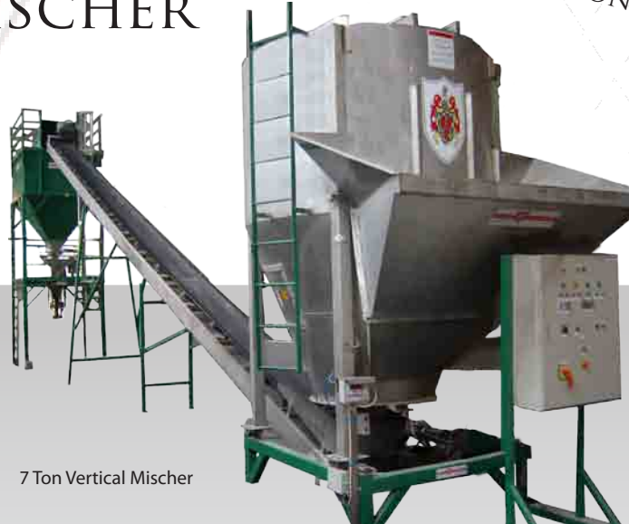
7 Ton Vertical Mischer

MISCHLEISTUNG 25 BIS 45 TON/M 3 PRO STUNDE MISCHER KAPAZITÄT 5,5-7-9-12 TON PRO CHARGE