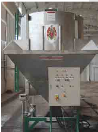
7 Ton Vertical Mischer

den Mischer, wo das eigentliche Mischen stattfindet. Die Schneckenwendeln sind 9 mm dick. Der gesamte Mischer ist aus rostfreiem Stahl gebaut. Das Kopfteil des Mixers ist geschlossen, jedoch enthält es eine Inspektionsluke. Die Maschine steht auf 4 Stützenbeinen und einem aus Normalstahl gefertigten Wiegeramen. Unter jeder Stütze ist eine rostfreie Druckmessdose angeordnet. Am oberen Ende des Mixers befindet sich ein Getriebe. Der E-Motor befindet sich an der Seite des Mixers. Die Kraftübertragung geschieht über V- Keilriemen. Die Maschine ist mit einem digitalem Wägeindikator und einem großem Display ausgerüstet. Der Vertical Mischer hat eine Kapazität von 5,5, 7 und 9 Tonne/m 3 pro Charge und eine Mischleistung von 25 bis 45 Tonnen/m 3 pro Stunde. Der Mischer kann nach Kundenwünschen variiert