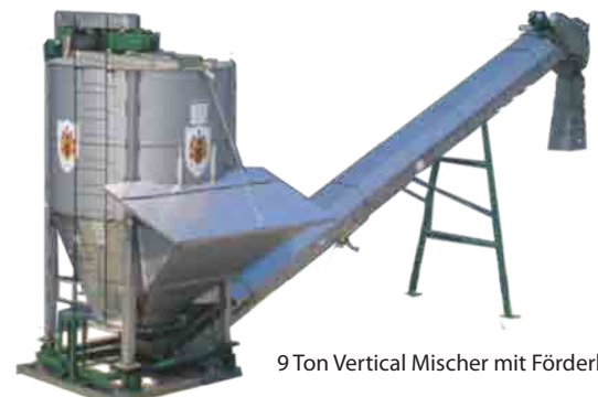
9 Ton Vertical Mischer mit Förderband