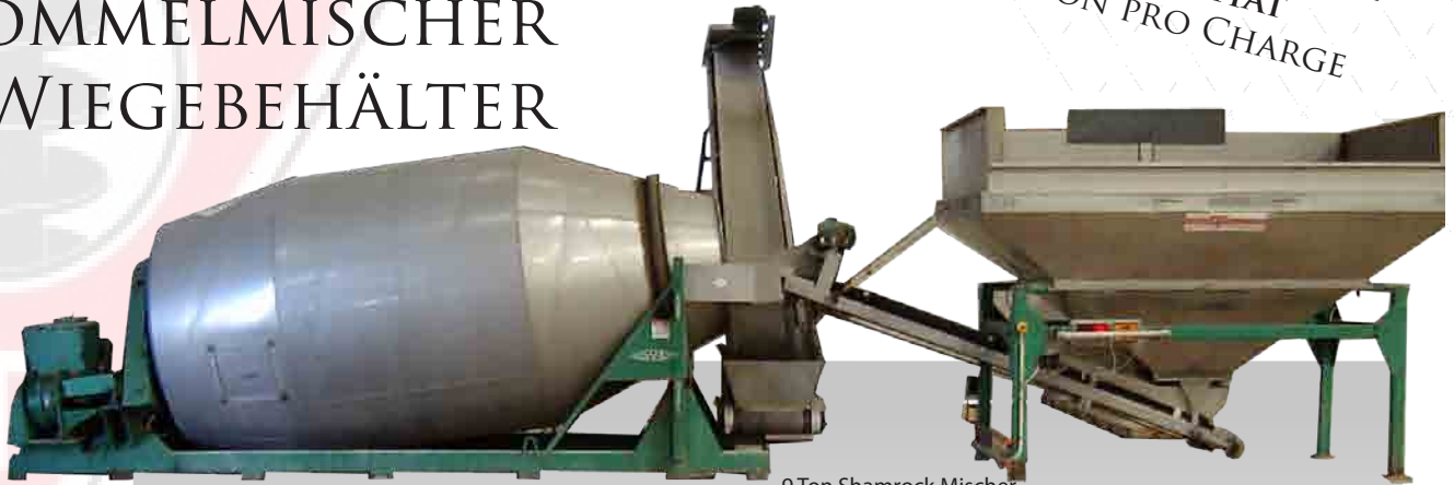
9 Ton Shamrock Mischer

MISCHLEISTUNG 20 BIS 60 TON/M 3 PRO STUNDE MISCHER KAPAZITÄT 4,5-5,4-7-9 TON PRO CHARGE